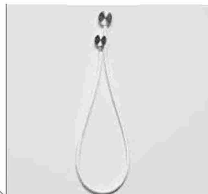
● Filtro , doccetta tonda con supporto a parete. www.antoniolupi.it