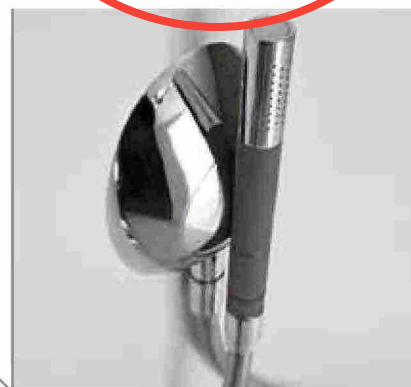
● Virgin , doccetta magnetica con presa a muro. www.zazzeri.it