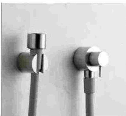
● Kay , doccetta con il getto kneipp e supporto a muro. www.minainox.com