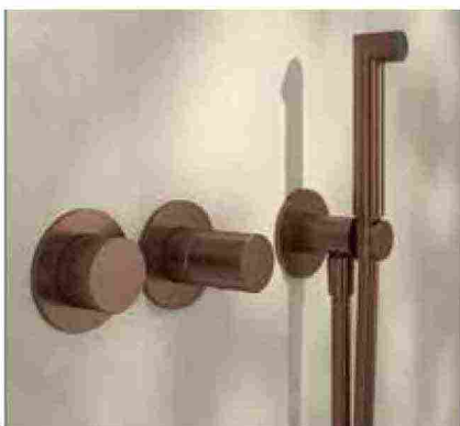
● 28 mm , dallo stile minimale e con diverse finiture. www.rubinetterie3m.it