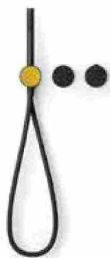
● Origini , doccetta in metallo con un tocco di colore. www.gessi.com